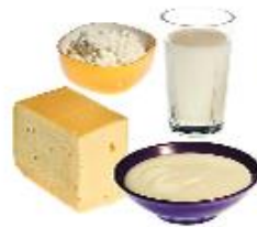
Mjólkurvörur Mjólk, sýrðar mjólkurvörur og ostur