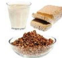
Vörur úr jurtaríkinu sem valkostur við dýraafurðir T.d. sojadrykkur, hafradrykkur og tofu