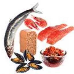
Fiskur og skelfiskur Fiskur og vörur úr fiski, ferskar eða frosnar