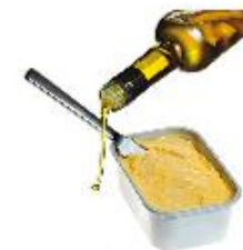
Matarolía og viðbit