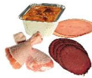
Kjöt og kjötálegg Ferskt eða frosið