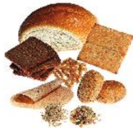
Brauð og kornvörur Brauð, pasta, hrísgrjón, morgunkorn og aðrar kornvörur