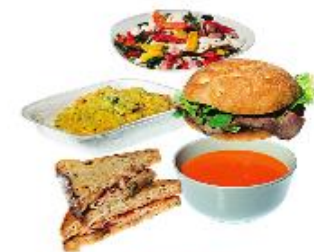
Tilbúnir réttir Súpur, pítsur, vefjur og samlokur