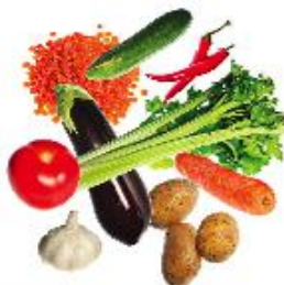
Grænmeti og kartöflur Ferskt, frosið eða varðveitt í vatni