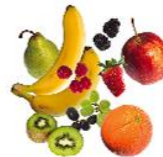
Ávextir og ber Ferskir eða frosnir